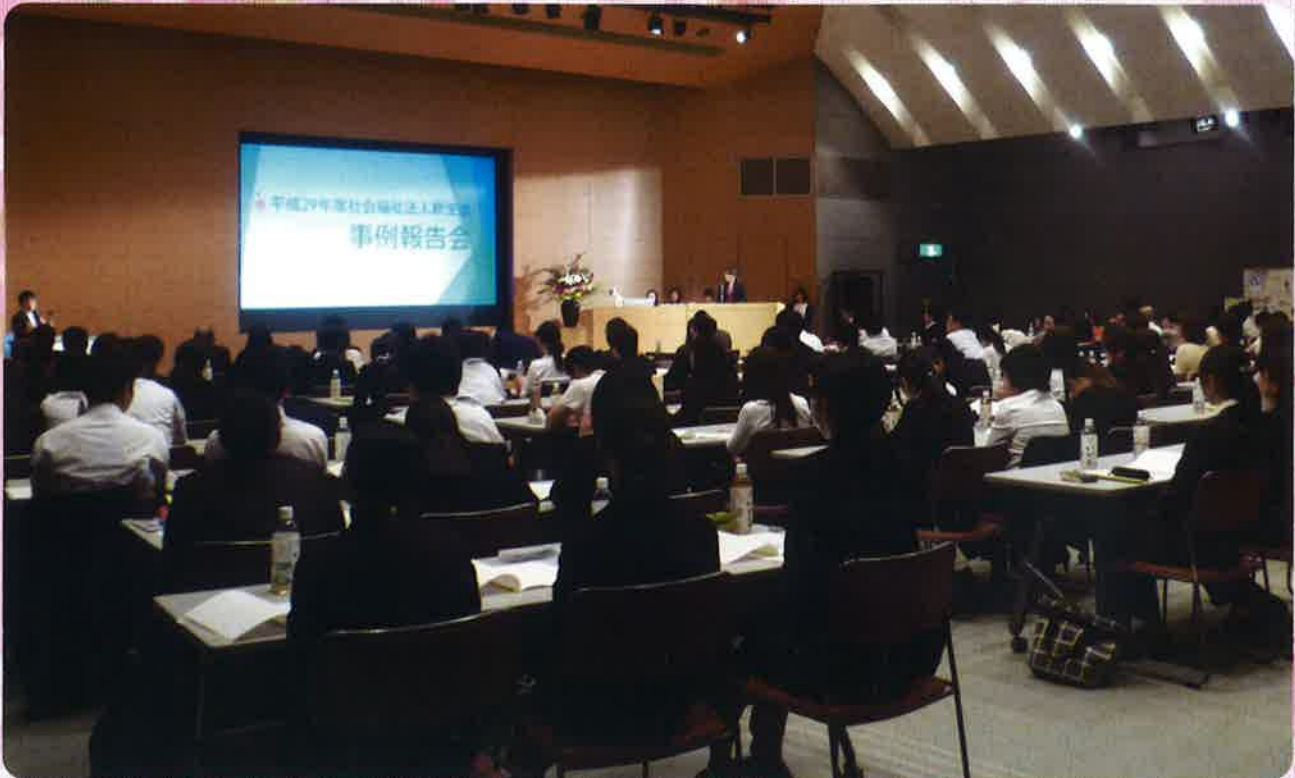
▶ 本年も大垣市情報工房にて実践事例発表会を行いました