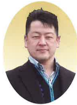
社会福祉法人 新生会 理事長・医師