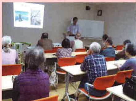
テーマに沿った話に真剣に、そして楽しく講座に向きあう参加者

この市民講座が、多くの住民の方に、ご自分の「これからのこと」について考えるきっかけになったようです。