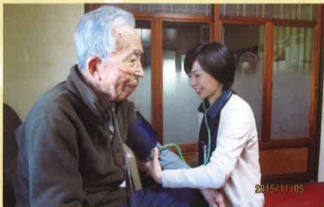
今日も主治医と連携を図り自宅へ健康管理、生活支援に出かけます

この、十二年ほどの間に「変わったね」といわれることが多くありました。これから一〇年後、二〇年後はどう変わっているでしょう。これからも自分の成長を楽しみたいです。