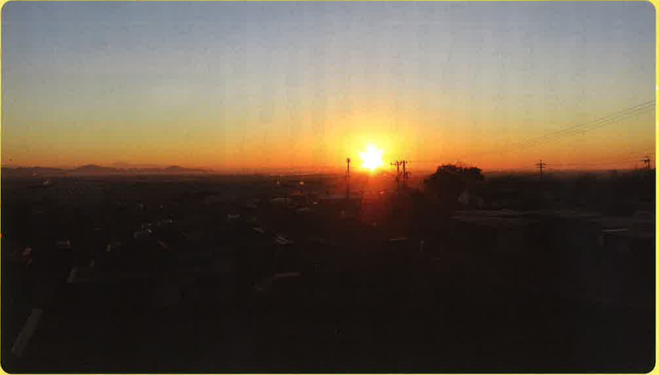
▶サンビレッジ宮路より朝日を望む