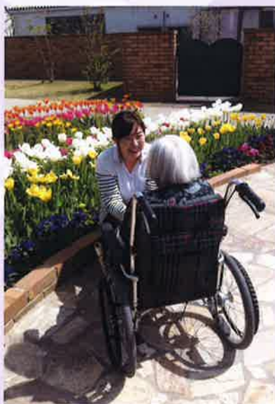
▶あたたかな陽さしの中で

私は高校生の頃、パーキンソン病の祖父を、両親とともに在宅で介護をしていました。在宅サービスを導入した際に、自宅に来て下さるヘルパーの方の介護をしている姿や、素敵なお顔をみて、私も将来は介護の仕事をしたかったのがきっかけとなり、サンビレッジ国際医療福祉専門学校を経て、新生会へと入社しました。現在は新生苑のチューリップ棟で勤務をしています。チューリップ棟には十二名の利用者の方々が生活しており、一人ひとり利用者の方の思いや、その方の生活背景を汲みながら日々のケアに当たっています。その中でも自分自身が一番大切にしている事は、利用者の方に対しての『笑顔』です。祖父を介護していたヘルパーの方の活き活きとした笑顔は、祖父本人はもとより、私たち家族にもここなら安心して任せられる、という思いを与えてくれました。私たちの役割、使命は利用者の方が最後まで安心してサンビレッジという生活の場で暮らせるよう支援することです。安心して暮らす為には介護をする職員が気持ちにゆとりを持ち、笑顔で接する事が大切になってくると思います。そしてそれをチームで共有し、ここで最期を迎えられて良かったと利用者の方に思っていただけのような、また、ご家族にとっても、大切な人を安心して任せられる場にしていききたいと思えます。これからも初心を忘れず、笑顔を大切に頑張っていきたいと思えます。