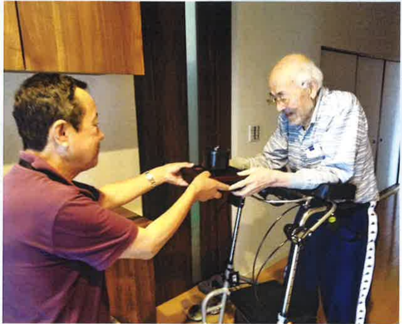
▶配食サービスとITを利用した新たな取り組み