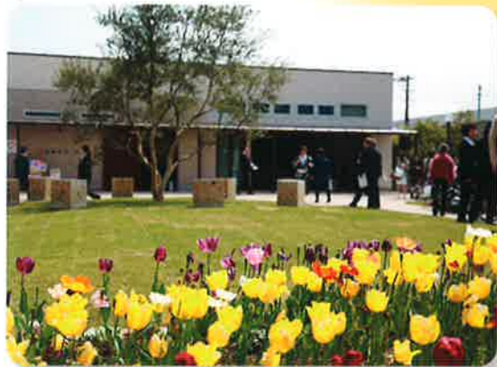
「チューリップガーデン」