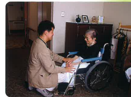
「医師による安心のサポート」

年を重ねると誰も健康が気になります。専任の医師があなたを見守り安心をお約束いたします。そして「人を見る」ことのできる看護師、作業療法士、言語聴覚士等や、協力病院が24時間の体制を整えています。「最後まで住み慣れた場所で過ごしたい」という“ターミナルケアサービス”も実施。ここに30年の実績が、信頼に繋がります。