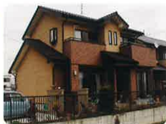
平成18年7月 「もやいの家(津村)」