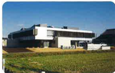
平成23年3月 デイサービスセンター 「もやいの家瑞穂」 グループホーム 「もやいの家(瑞穂)」