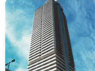
平成19年9月 住宅型有料老人ホーム「シティタワー・アンキーン」 デイサービスセンター「シティタワー・デイサービスセンター」 シティタワー・訪問看護ステーション 24時間保育(新生メディカル)訪問介護(新生メディカル) 高齢者賃貸住宅入所者支援サービス 交流ホール