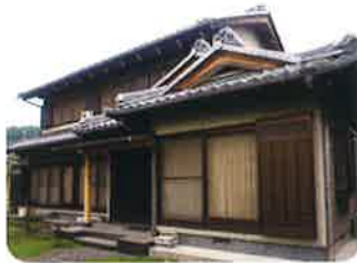
平成19年6月 小規模多機能型「もやいの家(市橋)」