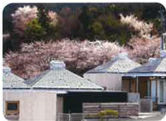
平成15年7月 住宅型有料老人ホーム 「サンヒルズ・ヴィラアンキーン」