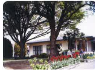
平成12年11月 グループホーム「木もれびの家」 平成16年3月 グループホーム「もやいの家(泉)」