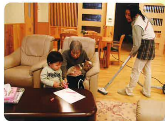
「赤ちゃんと過ごす一時」