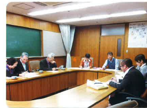
「利用者と立てるケア計画」

“よい介護はよい医療に勝るとも劣らぬ専門分野”との認識をもとに利用者の生活を支えます。最期まで人として支え誇りを大切にする介護のあり方をオーストラリアの海外研修で学び利用者の立場に立った介護を実践します。介護福祉士を始め各種の専門職が生活の質の向上、自立支援を目指し本人、家族と共に立てたケア計画を基に個々の生き方をお手伝いします。