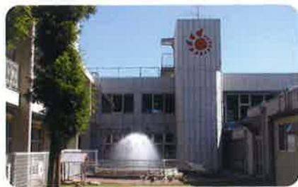
昭和51年4月 サンビレッジ新生苑開苑 昭和62年 デイセンター・認知症専用棟増床