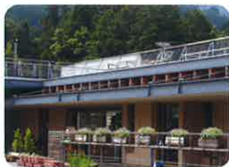
平成15年5月 サンビレッジ宮路 グループホーム「弥生」 デイサービスセンター「ちゃぼぼ」