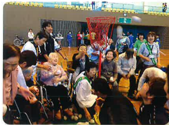
地域との交流「福祉運動会」

ホームをご利用になっても地域社会の一員としてあなたの尊厳は守られます。そして家族、友人、地域の人々との関係は太い絆のままです……。ここでのあなたらしい過ごし方は、どうぞあきらめないでご自身で考えて見て下さい。