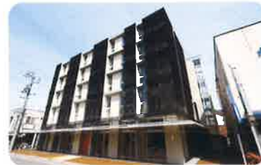
平成24年3月 グループホーム 「もやいの家 しんせい」 小規模多機能型 「もやいの家 チクタク」 住宅型有料老人ホーム 「ほづみ駅前 アンキーン」