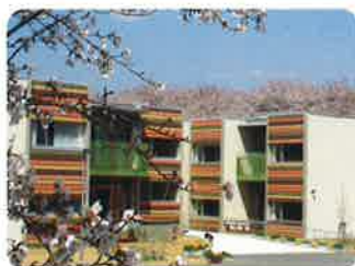
平成18年3月 サテライト型特別養護老人ホーム デイサービスセンター「サンビレッジ大垣」 グループホーム「さくら・さくら」