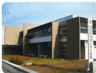
平成24年3月 リハビリセンター白鳥デイサービスセンター ショートステイ 地域密着型特養 グループホーム 多世代交流カフェ