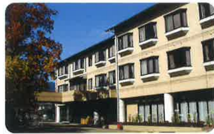
平成5年12月 今村勲記念館 (個室・ユニットケア対応)