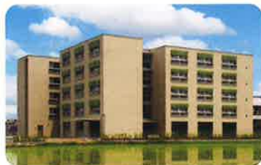
平成23年9月 特別養護老人ホーム 「サンビレッジ瑞穂」 デイサービスセンター 「サンビレッジ瑞穂」