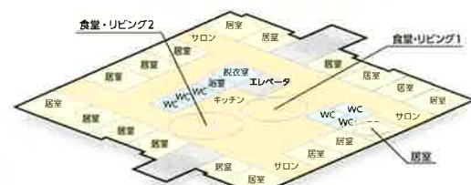
2階 グループホーム