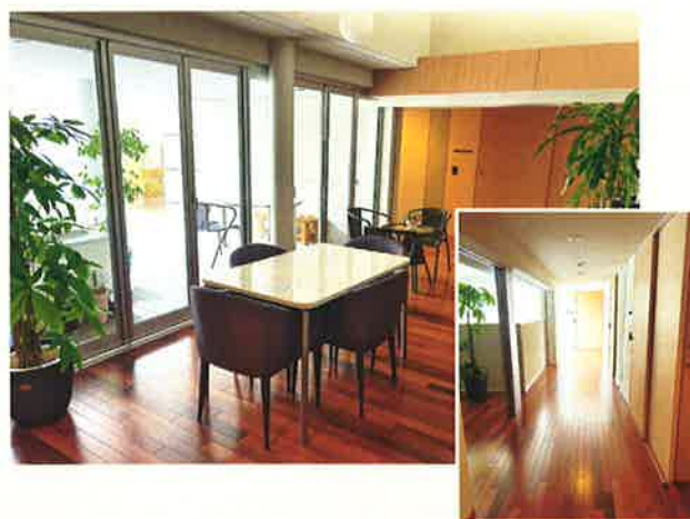
Map 岐阜県瑞穂市別府1193番地1 〔JR穂積駅から徒歩7分〕

新生グループは、特別養護老人ホーム、デイサービス、ショートステイ、訪問介護、訪問看護、福祉器具の貸与、配食サービスなどの機能を、岐阜県内にネットワークを組んで提供しています。新生会の50年の歴史と信頼が皆さまの生活を支えます。